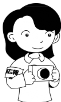
広 報 部