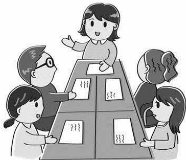
学 年 部